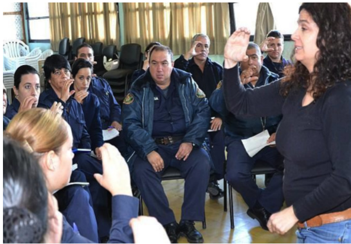
Slika 2: Lokalna policija pohađa kratku obuku o znakovnom jeziku

Konkretan primer napora mreže osoba sa potpunim oštećenjem sluha da unaprede pristup socijalnim uslugama predstavljaju seminari obuke koje su sproveli zajedno sa policijom Montevidea kako bi se službenici policije upoznali sa osnovama znakovnog jezika. Takva obuka je obostrano korisna: za policiju, kako bi efektivno komunicirala sa građanima sa potpunim oštećenjem sluha u pogledu njihovih zakonskih prava, a i podučila ih o tome šta predstavlja kršenje prava i kako da prijave zloupotrebe, itd.